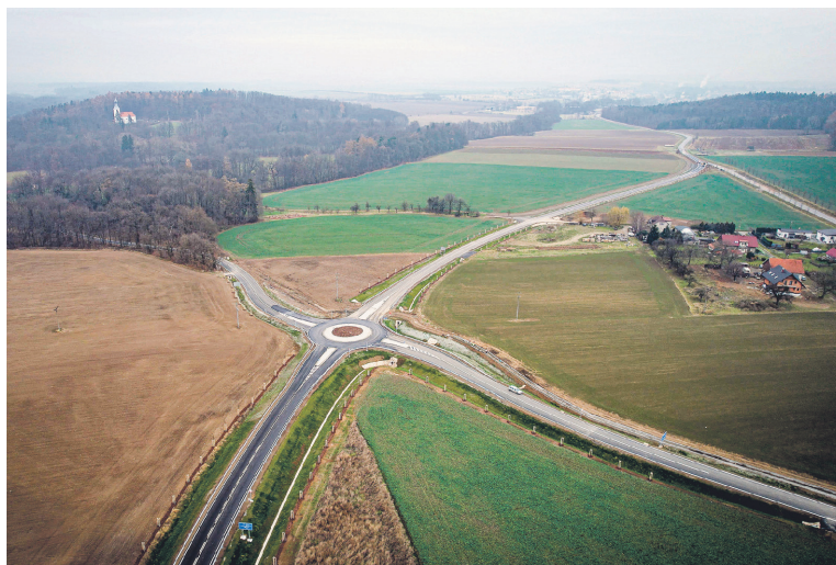
Letecký pohled na nový obchvat okolo Domašina.

„Tato stavba je významná z hlediska dopravního napojení průmyslové zóny Solnice-Kvasiny zejména ve směru na Hradec Králové a Prahu. Jedná se o první akci financovanou z prostředků SFDI v rámci usnesení vlády. Provoz mezi Solnicí a Častolovicemi bude plynulejší a bezpečnější pro všechny motoristy, ale především se velmi uleví místním občanům, které zatěžovala nadměrná kamionová doprava. Dopravní situace v okolí průmyslové zóny řešíme komplexně pomocí celé řady obchvatů, jejichž výstavbu připravuje