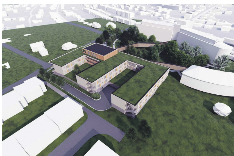
Vizualizace nového komplexu v Domově U Biřičky.

Současně kraj pracuje na projektové přípravě dalších projektů v hodnotě přes miliardu korun a počítá s výraznou dotační podporou ze Strukturálních fondů Evropské unie.