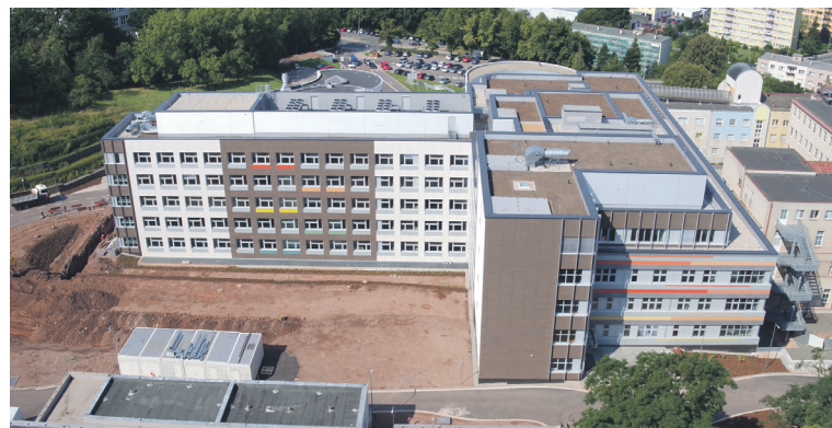
Modernizace náchodské nemocnice bude pokračovat.

Na tuto investici by letos měly navázat mnohem rozsáhlejší