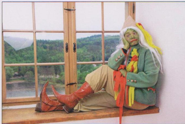
Kategorie LIDÉ: 1. místo – Vypuštěná přehrada aneb konec vodníka na Plumlově? / Jarek Hruška