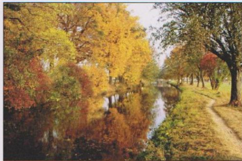
Kategorie PŘÍRODA: 3. místo – Lítovel u splavu podzimní zrcadlení / Jana Bednářová