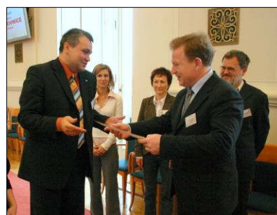
Předání ceny vítěznému projektu z Kopřivnice.

Soutěž pořádá CpKP ve spolupráci s týdníkem vlády Veřejná správa, za finanční podpory Evropské unie a Visegrádského fondu a pod záštitou Ministerstva vnitra a Ministerstva životního prostředí.