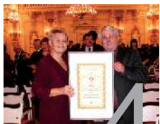
Úřad získal cenu za kvalitu služeb.