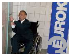
Eurokličo pomáhají handicapovaným.