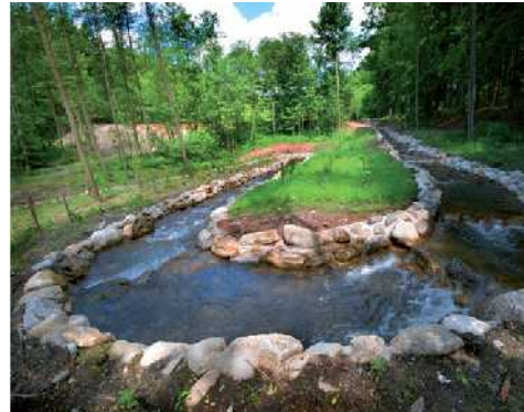
Další oceněná stavba: V Prkenném Dole stavbaři upravili tavný rybník a vybudovali rybní přechod.

okolní zástavby. Má prakticky řešený inženýrský a ohledem na to, že ho budou obývat děti, v jednom kolektivu zde budou spojeny různé věkové kategorie i zkravotně