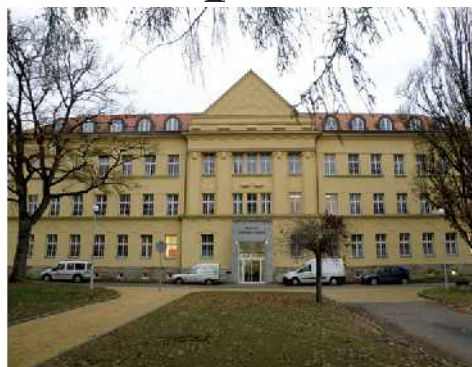
V Oblastní nemocnici Jičín byl začátkem měsíce otevřen nový pavilon interních oborů.

„Teprve s pomocí Královéhradeckého kraje se nám podařilo záměr zrealizovat. V areálu bychom chtěli časem rekonstruovat a zmodernizovat ještě jeden pavilon,“ řekla ředitelka jičínské