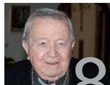
Arcibiskup nejen o Vánocích.