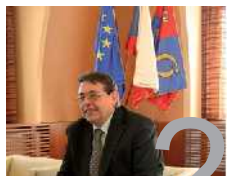
Hejtmán: „Chceme pracovat pro lidi...“