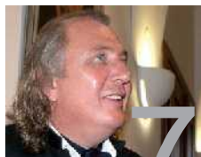
V Hradci Králové nová galerie.