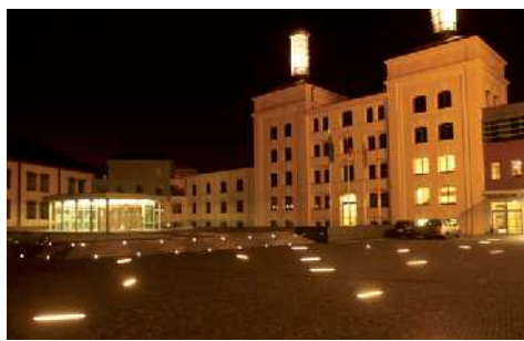
Stavbou roku je Regio centrum Nový pivovar, které má své kouzlo nejen ve dne, ale díky osvětlení také v noci.

z více než šesti desítek staveb v České republice. Kromě ocenění stavba roku zvítězil královéhradecký Nový pivovar i v hlasování veřejnosti na internetu. Lidé mu jako stavbě, která je nejvíce zaujala, poslali více než osmáct tisíc hlasů. S velkým odstupem se za Novým pivovarem umístilo ve veřejné soutěži pražské metro na trase Ládví - Letňany a nový fotbalový stadion SK Slavia Praha. V loňském roce v hlasování veřejnosti zvítěžilo letiště Brno, které získalo zhruba dvacet tisíc hlasů. Titul Stavba roku udělili letos odborníci už po šestnácté.