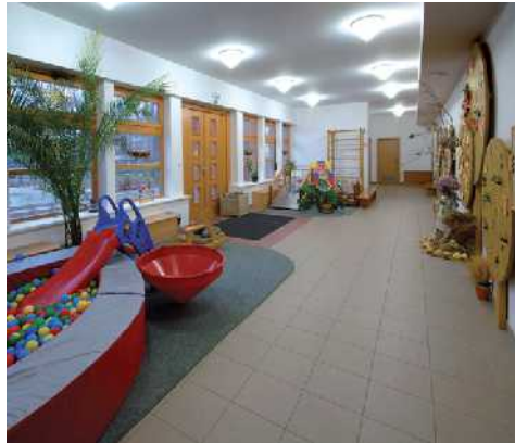
Titul „Stavba roku Královéhradeckého kraje 2008“ získala i mateřská škola v Hostinném. Porota zaujala nejen samotná stavba, ale i vzhled jejího interiéru.

Titul Stavba roku Královéhradeckého kraje 2008 v polovině října obdržely bytový dům v Jičíně, Mateřská škola Týrosy sady v Hostinném a úpravy rybníku v Prkenném Dole. V rámci vyhlášení stavby roku, které se uskutečnilo v Regio centru Nový pivovar, bylo rozdáno také pět čestných uznání.