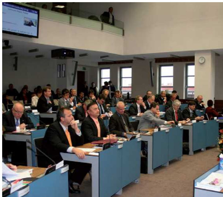
Zastupitelé Královéhradeckého kraje na svém ustavujícím zasedání.

deckého kraje pracují odborníci, které potřebujeme. Pokud nastanou nějaké personální změny, budou se týkat pouze lidí, které si do funkce zcela jasně dosadila ODS jako své známé. Zaměstnanců, kteří dělají svou práci dobře, si vážíme a nerádi bychom o ně přišli.“