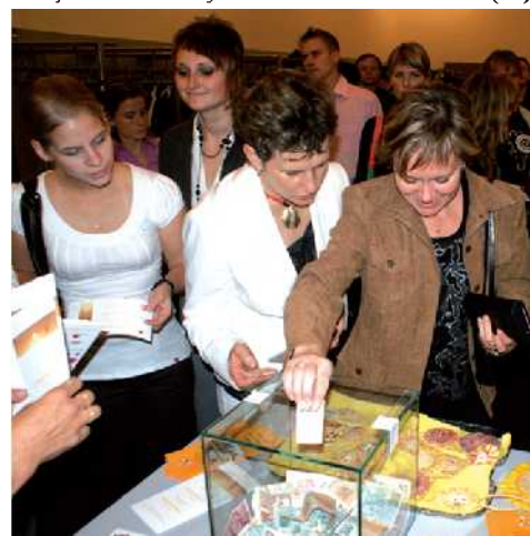
Výtěžek z benefičního vystoupení, které pořádalo Občanské sdružení rodičů při Speciálních školách v Hradci Králové, bude příděm k částce, za kterou se v budoucnu pořídí snoezelen.

vnímání pomocí světa, zvuku, pocitu a vůně. Projekt je finančně narocný, v řádech statisíců, plánujeme proto další aktivy, díky kterým u nás uvidený zaměřujeme zajistit prostředky.“ uvedl Pavel Zahálka z Občanského sdružení rodičů při Speciálních školách v Hradci Králové. (nec)