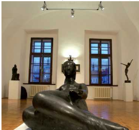
V galerii Tří generace Kodetů jsou nejen díla Kristiána Kodeta, ale také jeho předků.

ní řadě mě zejména dílo rodný Kodetů. Musím říct, že se mi vy-