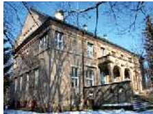
Vila Čerych jako vzácný architektonický objekt je společně s přílehlou zahradou Lanensena do seznamu chráněných památek.

Památkově chráněný objekt - Vila Čerych v České Skalici, je od roku 2001 ve vlastnictví Nadace rozvoje občanské společnosti. Klenot české předválečné architektury ve stylu art deco je příkladem úspěšného projektu zastřešujícího aktivity zaměřené na příhraniční spolupráci, regionální rozvoj, ekologii, obnovu venkova, profesio-nalizaci neziskového sektoru a podporu místní kultury.