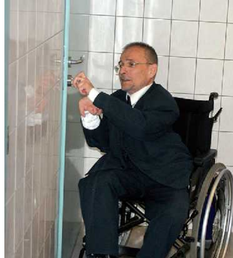
Předseda Národní rady zdravotně postižených ČR Václav Krása evrokličem otevírá první dveře v Královéhradeckém kraji.

Lidem se zdravotním postižením v Královéhradeckém kraji začnou otevírat dveře k důstojnějšímu cestování či návštěvám kulturních a společenských akcí evrokliče. Stejnomený projekt, který se začíná zavádět v kraji, zjednoduší handicapovaným prostřednictvím speciálního klíče přístup na toalety na veřejných místech.