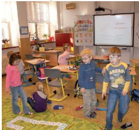
Moderně vybavené třídy pro děti s vadami zraku byly slavnostně otevřeny v listopadu v hradecké ZŠ Jiráskovo náměstí.

„Jak uvedl ředitel školy Hynek Martinek, stavební práce by měly trvat do konce příštího roku. V Rychnově byla v září rovněž podepsána smlouva, která se týká výstavby nové budovy hasičů. Realizace tohoto projektu, který financuje stát, by měla vyjít na zhruba 200 milionů korun. Nynější stavěné již stavební ani