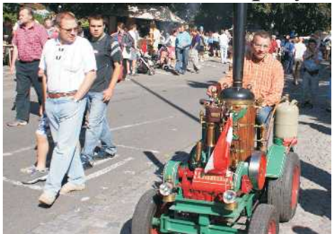
Královéhradecký klub přátel parních strojů v Hradci Králové 30. srpna uspořádá již šesté mezinárodní Nábržní parní dny. Kromě parních strojů na místě nechyběly napříč atrakce pro děti.