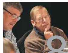
Klícporovo divadlo chystá Odcházení.