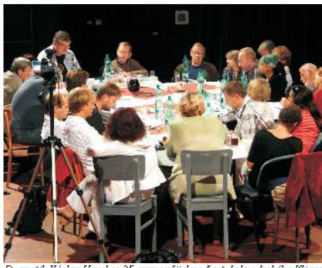
Dramatik Václav Havel se 25. srpna přijel podívat do hradeckého Klicperova divadla na první zkoušku své nové hry.

Další premiérou chystáme na 11. října. Hra se jmenuje Odchá-