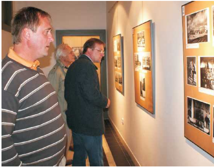
Výstava „Srpen 68–40. výročí okupace Československa vojsky Varšavské smlouvy“ byla v Muzeu východních Čech v Hradci Králové zahájena 20. srpna ve 23.15 hod., tedy přesně čtyřicet let poté, co na letišti v Praze přistála první sovětská letadla.