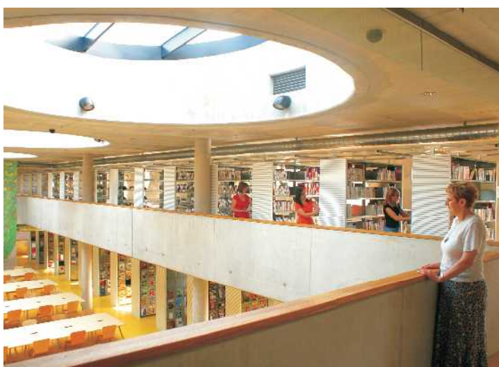
Studijní a vědecká knihovna v Hradci Králové působí moderním vzhledem nejen při pohledu zevně, ale také uvnitř.

„Čtenářům bude sloužit knihovni automat, který umožní, aby si knihu půjčili domů bez pomoci knihovnicků. Vlastně to bude taková výpůjční samoobsluha, v jejíž obsluhu bude náš personál čtenáře školit. K modernímu pojetí inte-