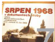
V muzou je výstava o srpnu 1968.