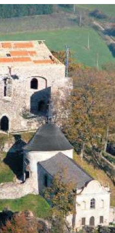
Snímek zychycuje hradní palác při opravě střechy.

Uvedl, že obec vkladá do oprav hradu nemalé peníze. V současné době dává do pořádku například torzo hradní studny a zbytky zdi. „Musíme dbát o bezpečí turistů, kterých chodí na hrad čím dál tím více“ zdůraznil Dostál. Loni se na