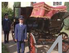
Biskupský kočár byl opraven.