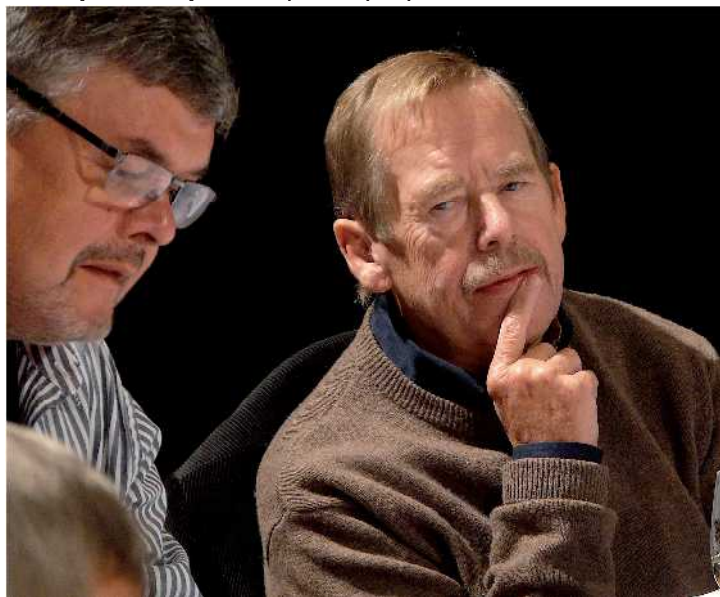
V Klicperově divadle je nyní intenzivně nacvičována nejnovější hra Václava Havla Odcházení. Pokud bude autor zdravý, zúčastní se 11. října premiéry.