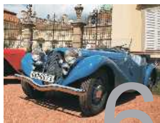
Historické vozy projely krajem.