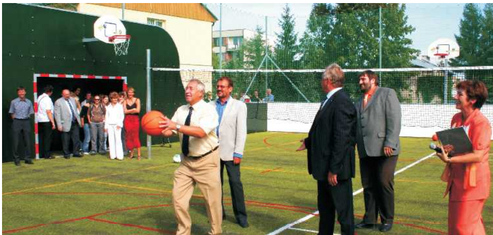
Ve Střední škole potravinářské ve Smiřicích je od září nový víceúčelový sportovní areál.