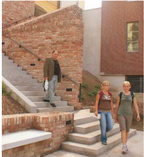
Opravené schodiště Kozinka, které je v blízkosti historického centra Hradce Králové, se znovu proměna bývalého hradeckého pivovaru a jeho okolí. Vedle schodiště Kozinka lidem slouží i nové spojení historického středu krajského města z Komenského ulice.