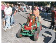
Parmlívali se sjíli do Hradce Králové.