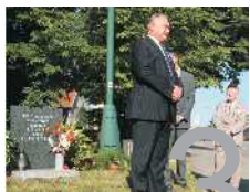
V Jičíně uctili památku obětí okupace.