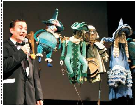
Sobota 6. září se v Hradci Králové nesla nejen ve znamení tradičních slavností loďovny Elišky, které byly zakončeny ohňostrojem, ale také ve znamení oslav významného jubilea Divadla Drak, které oslavilo padesát let od svého založení.