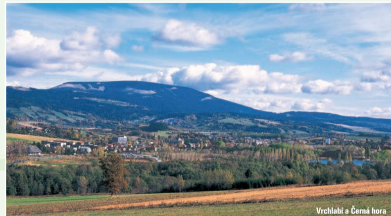
Vrchlábí a Černá hora

Z Janských Lázní na Černou horu vyjedeme kabinovou lanovkou. Cyklotrasou KRMAP č. 19A kolem Černé boudy dojedeme k cyklotrasě KRMAP č. 1B. Po této cyklotrasě budeme míjet Kolínskou boudu a dojedeme až k Tetěví boudám. Zde odbočíme vpravo na cyklotrasu KRMAP č. 18, po které dojedeme pod Lahrovu boudu. Odbočíme vlevo na cyklotrasu KRMAP č. 1A a sjedeme k Hřibčím boudám. Z Hřibčích bud můžeme dojet do Vrchlábí dvěma cestami: A: Do Lánova se vydáme po cyklotrasě KRMAP č. 1B, ze které odbočíme vpravo na cyklotrasu KRMAP č. 1C. Po ní Luisiným údolím, přes Dolní Dvůr, dojedeme až do Horního Lánova. V Horním Lánově u kravína odbočíme vpravo na cyklotrasu 4301, po které dojedeme do Vrchlábí. B: Do Strážného pokračujeme po cyklotrasě KRMAP č. 1A a dále do Vrchlábí sjedeme po silnici.