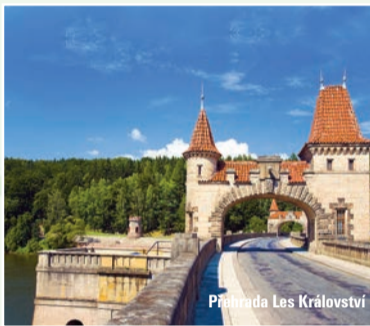
Přehradna Les Království