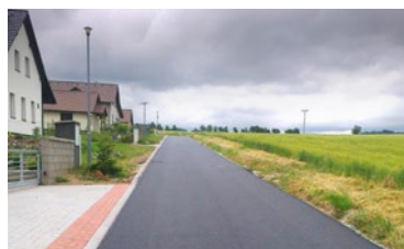
▲ ... a po obnově.