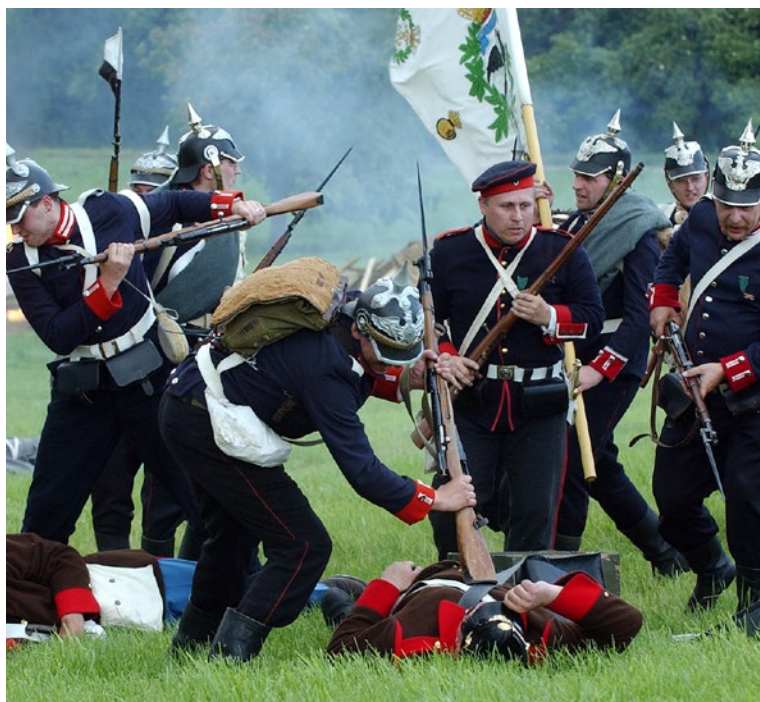
▲ Bitva 1866 u Hradce Králové – vzpomínkové akce 2004