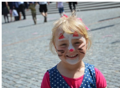
▲ Malovalo se na obličej