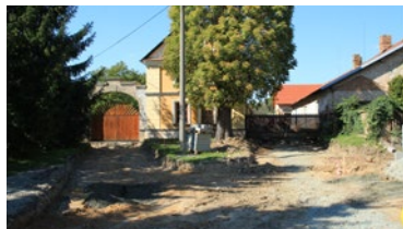
▲ Očelice před...