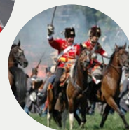
Velký kalendář letních akcí STRANA 8