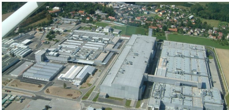
▲ Průmyslová zóna Kvasiny ze vzduchu v roce 2006