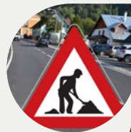
Přehled uzavírek na léto STRANA 6