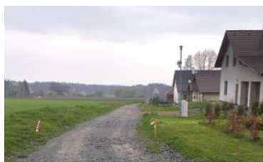
▲ Bačetín před...