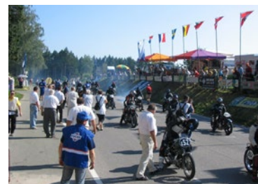
▲ Motozávody v Hořicích 2008