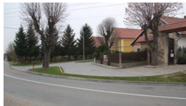
▲ ... a po obnově.