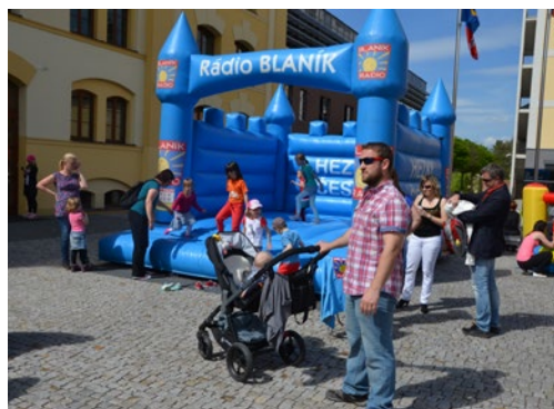
▲ Po celý den tu byl zábavný program pro děti