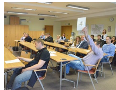
▲ Dražba na Krajském úřadě KHK.