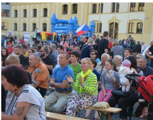
▲ Příznivců hokeje se sešlo opravdu hodně