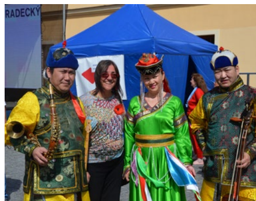
▲ Vystoupili umělci až z Mongolska