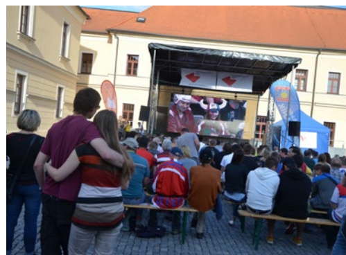
▲ Pro fanoušky se promítal zápas českého týmu