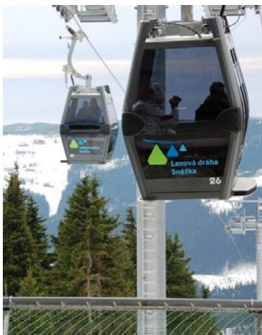
▲ První lidé v lanovce na Sněžku 2013