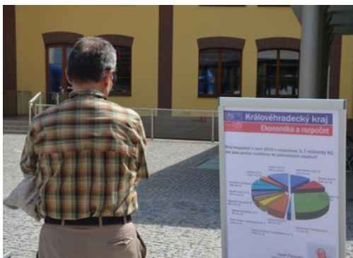
▲ Lidé se dočetli zajímavosti o kraji