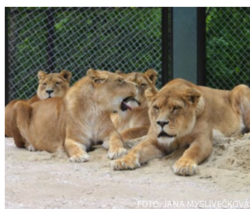
▲ Čtyři nové samice přicestovaly z holandské ZOO v Arnhemu.