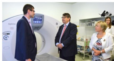
▲ Uvedení nového CT do provozu za účasti hejtmána Lubomíra France a radní pro zdravotnictví Jany Třešňákové.

už teď. I proto se na léto chystá oprava operačních sálů,“ řekl hejtmán Královéhradeckého kraje Lubomír Franc. „Nové vybavení se pořizuje postupně do všech krajských nemocnic. Jedná se o přístroje za zhruba 70 milionů korun,“ doplnila radní pro oblast