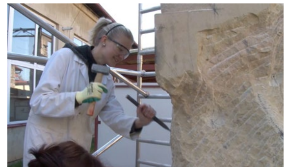
▲ Na soše Cesta ke smíření pracovali studenti hořické školy.