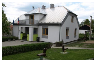
▲ ... a po obnově.

V loňském roce v kategorii obnovy a údržby venkovské zástavby a občanské vybavenosti patřily k nejnákladnějším projektům oprava obslužného objektu na víceúčelové hřišti ve Střevači, úpravy sokolovny v Praskače, zateplení obecního úřadu v Bílém Újezdě a oprava kaple Nejsvětější Trojice v Lhotě pod Libčany. Ve