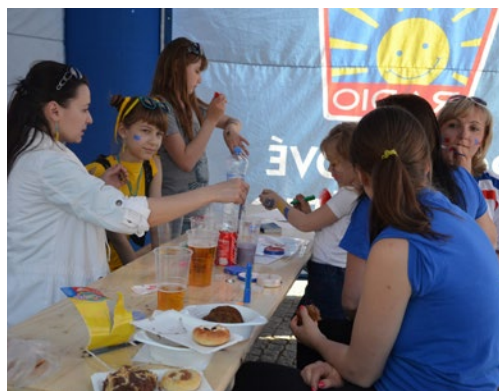
▲ Tváře zdobila česká vlajka