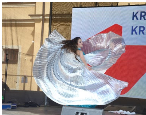
▲ K vidění byly orientální tance