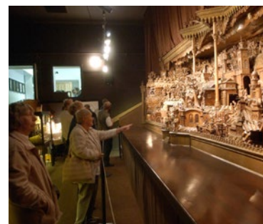
▲ Třebechovický betlém s návštěvníky 2004