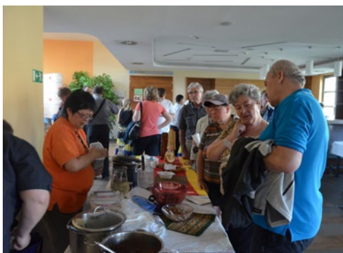
▲ Ochutnávala se mezinárodní kuchyně