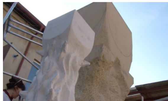
▲ Model a realita. Do Kostnice pojedou třímetrová socha symbolizující kalich v plamenech.

dostane až do Kostnice, je nejen skvělou vizitkou školy, ale i celého kraje. I proto jsem ukázal model sochy prezidentu Zemanovi během jeho poslední návštěvy