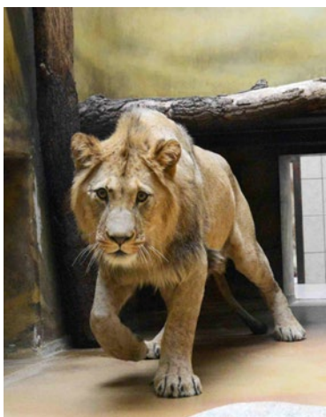
▲ Lev Bart poprvé v ZOO Dvůr Králové

Královéhradecký kraj je tu s Vámi už 15 let, a proto jsme se rozhodli vybrat pro Vás pár snímků z historie. ▶ red