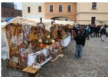
▲ Pivovarské trhy na novém nádvoří Regiocentra 2007