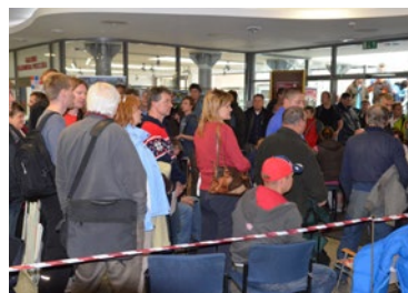
▲ Fronta žadatelů o kotlíkové dotace 2014