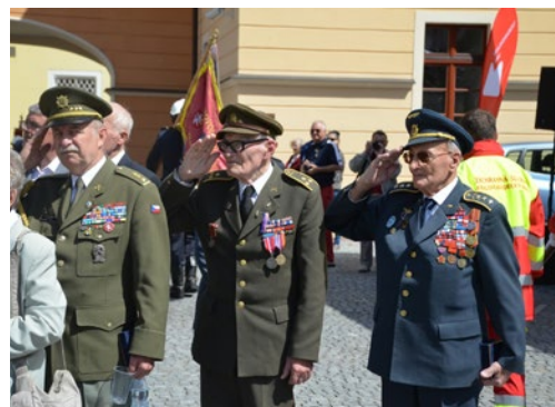
▲ Ocenění byli i váleční veteráni