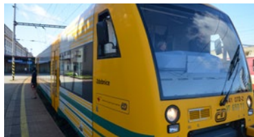
▲ Nové vozy jsou pojmenovány po řekách, které krajem protékají.

„Ve spolupráci s Českými drahami se snažíme poskytnout cestujícím, kteří využívají železniční dopravu, větší komfort a motivovat k jízdě veřejnou dopravou víc lidí. Z krajského rozpočtu to-