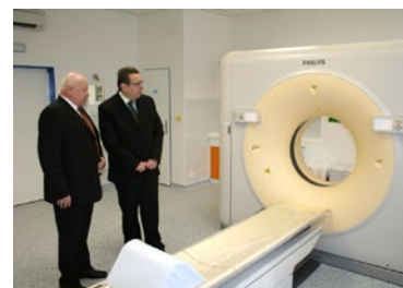
▲ Otevření CT ve Dvoře Králové nad Labem 2009