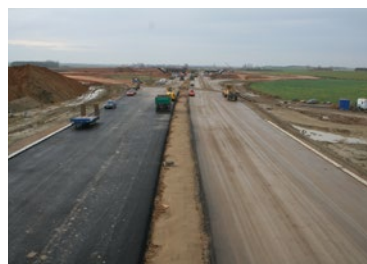
▲ Výstavba dálnice D11 v roce 2006