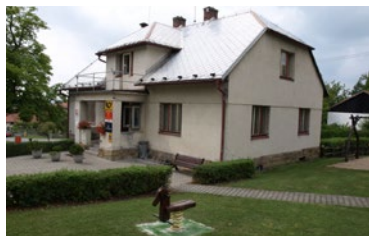
▲ Bílý Újezd před...