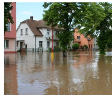
▲ Povodně Nový Bydžov 2013