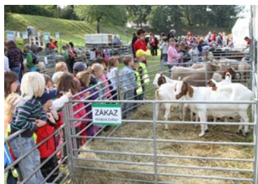
▲ Krajské dožínky v roce 2011