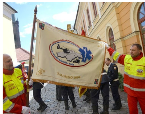
▲ Krajská záchranka dostala nový slavnostní prapor