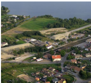
▲ Stavba obchvatu České Skalice 2007