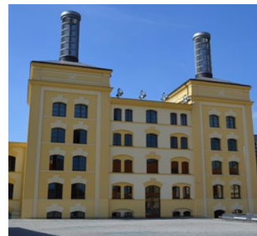
▲ Regiocentrum - sídlo kraje Stavbou roku 2008