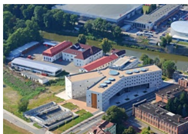
▲ SVKHK Studijní a vědecká knihovna v Hradci Králové 2008