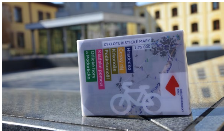
▲ Obrovský úspěch přineslo vydání nových krajských cyklomap