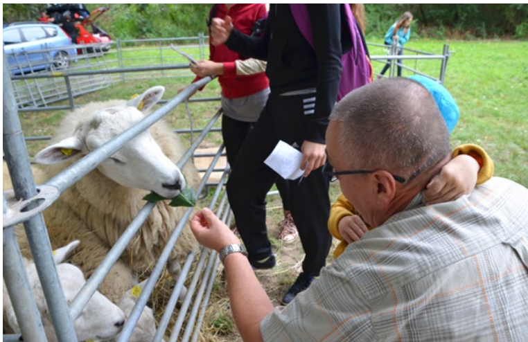
▲ Letošní dožínky navštívilo rekordních 30 tisíc lidí

Jaký byl ten letošní rok pro Královéhradecký kraj a jaké přinesl úspěchy a překvapení? Podívejte se obrazem. >