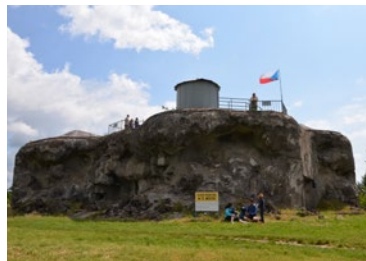
▲ Kraj získal do vlastnictví první národní kulturní památku – pevnost Dobrošov