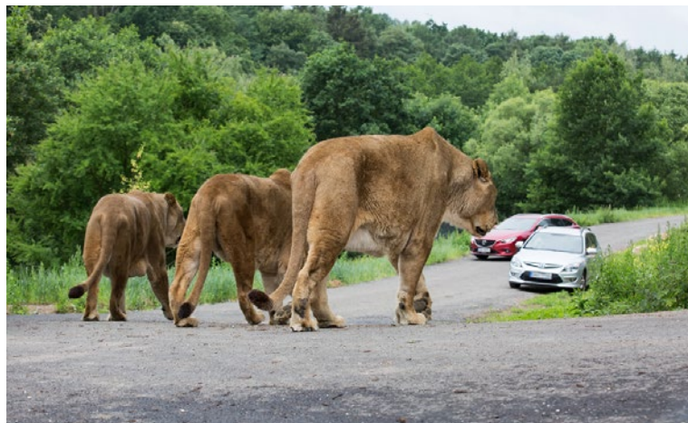
▲ V létě úspěšně otevřela krajská ZOO dlouho očekávané Lví safari