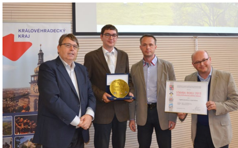
▲ Předávání cen Stavba roku Královéhradeckého kraje

Do soutěže bylo letos přihlášeno dvanáct staveb, tedy stejný počet jako v loňském roce. Vedle Královéhradeckého kraje je pořadatelem soutěže Česká komora autorizovaných inženýrů a techniků činných ve výstavbě, Český svaz stavebních inženýrů, Svaz podnikatelů ve stavebnictví a Česká komora architektů. ▶ red