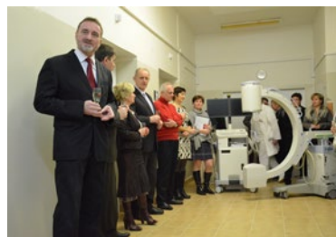
▲ Řada krajských nemocnic získala moderní vybavení