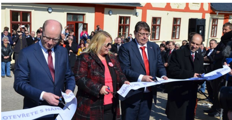
▲ Po náročné rekonstrukci se znovu otevřel barokní hospital Kuks