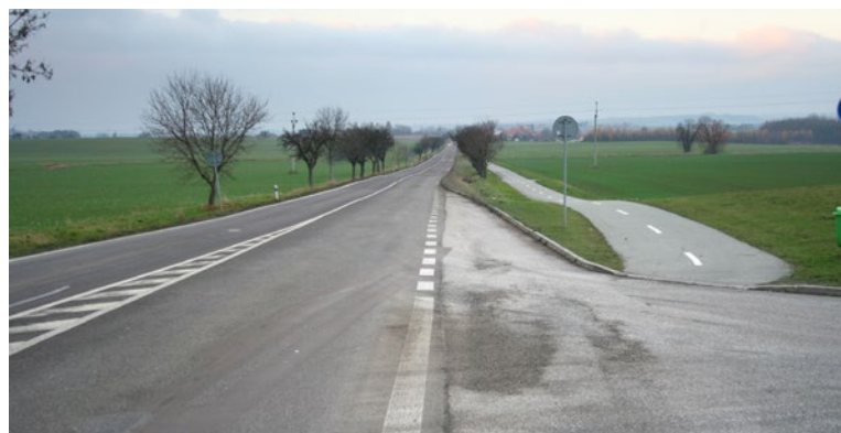
▲ Místo, kde bude nový kruhový objezd.

První etapa obchvatu vznikala od dubna do listopadu roku 2011 a měří jeden kilometr. Stavba byla slavnostně otevřena 14. prosince 2011. > red