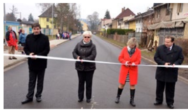
▲ Slavnostní otevření u podniku KRPA

V rámci druhé etapy rozšiřování průmyslové zóny je v plánu ještě oprava silnice II/295 z Dol-