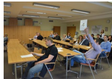
▲ Nečekaný výsledek dražby – kraj získal za bývalou školu ve Špindlerově Mlýně trojnásobek odhadu