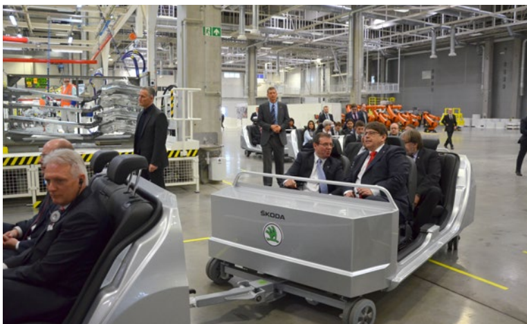
▲ Podepsání memoranda v Kvasínách znamenalo miliardové investice do průmyslové zóny