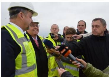
▲ Rozjela se jednání o dostavbě D11 a dalším postupu